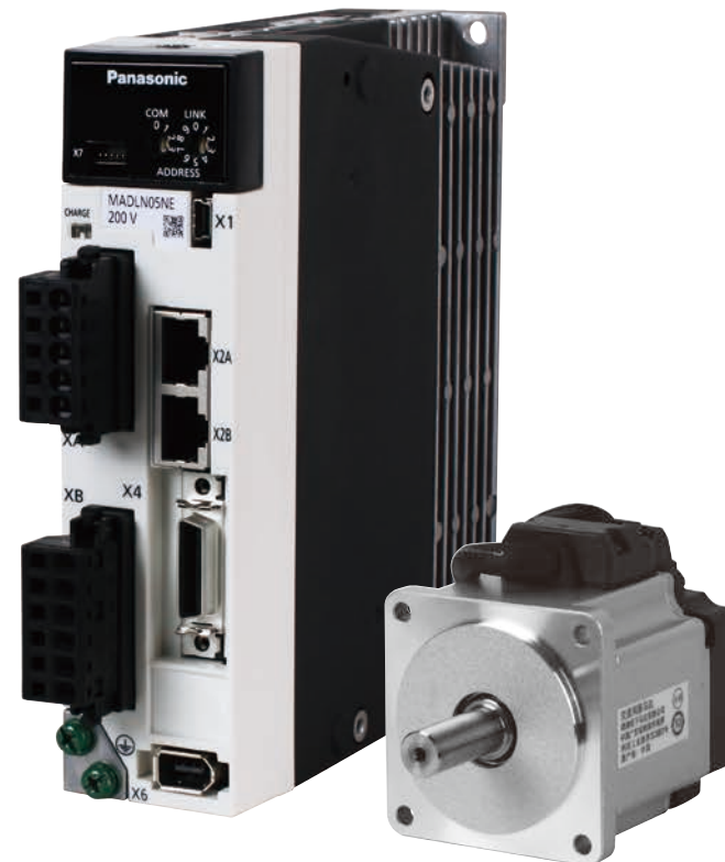
高速・高精度 ACサーボモータ MINAS A6N