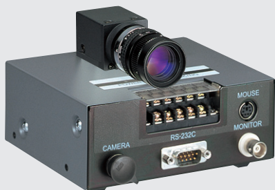
定置式QD20SX(デコーダ分離型)